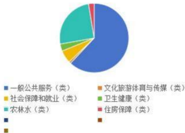
财政拨款支出构成情况

2022 年度财政拨款支出 744.27 万元，主要用于以下方面：一般公共服务（类）支出 461.41 万元，占 61.9%，主要用于日常运转基本支出；文化旅游体育与传媒（类）支出 6.85 万元，占 0.9%，主要用于其他文化旅游体育与传媒等支出；社会保障和就业（类）支出 44.36 万元，占 5.9%，主要用于机关事业单位保险缴费等支出；卫生健康（类）支出 24.83 万元，占 3.3%，主要用于行政单位医疗保险缴费等支出；农林水（类）支出 187.17 万元，占 25.1%，主要用于对村民委员会和村党支部的补助和其他农村综合改革等支出；住房保障（类）支出 19.65 万元，占 2.6%，主要用于住房公积金等支出。