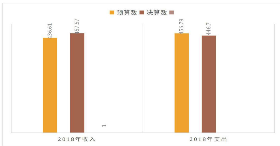
图 3：2017-2018 年财政拨款收支情

本部门 2018 年度形成的财政拨款收支均为一般公共预算财政拨款，其中一般公共预算财政拨款本年收入 457.57 万元，比 2017 年度减少 95.94 万元，降低 17.60%，主要是响应国家号召，缩减成本，退休人员工资不在单位发放；本年支出 457.57 万元，减少 101.62 万元，降低 18.17%，主要是响应国家号召，缩减成本，退休人员工资不在单位发放。