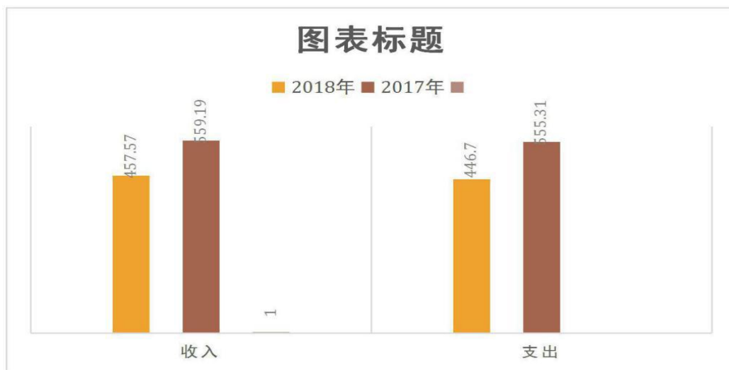
图 4：财政拨款收支预决算对比情况